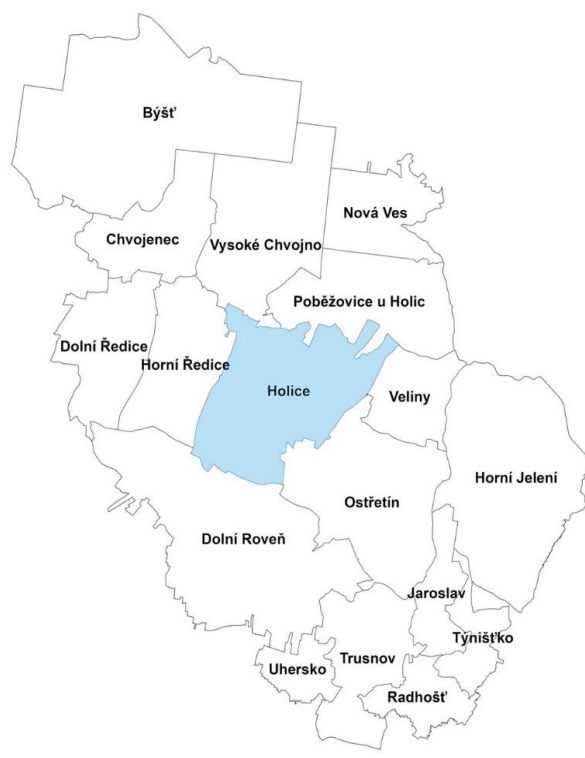
Podpořené projekty ze Strategie CLLD MAS Holicko 2021-2027(2030) dle obcí v přepočtu na 1 obyvatele

Čerpání podpory v Kč / 1 obyvatele k 31.12.2024: