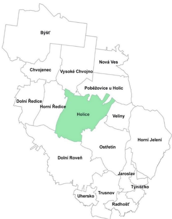
Podpořené projekty ze Strategie CLLD MAS Holicko 2021-2027(2030) dle obcí