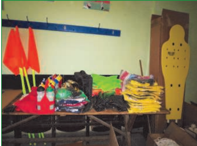
Fiche 1—Volný čas aktivně (6. výzva MAS)

Cílem projektu byla výstavba nového multifunkčního hřiště a běžecké dráhy na pozemku, kde bylo umístěno nevyhovující školní hřiště. Hřiště bude využíváno pro několik sportů mimo jiné i fotbal, basketbal, volejbal a tenis. Součástí areálu je i dráha pro skok daleký.