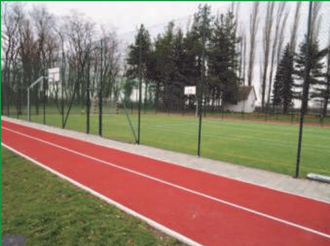
Fiche 1—Volný čas aktivně (5. výzva MAS)

Projekt řešil systém vytápění a osvětlení v budově sokolovny v Holicích zajišťující příznivé klimatické podmínky od nejmenších dětí po seniory s odhadovanou spotřebou energií na úrovni 45-55% stávajícího stavu s naprosto ekologickým a obnovitelným zdrojem tepla.