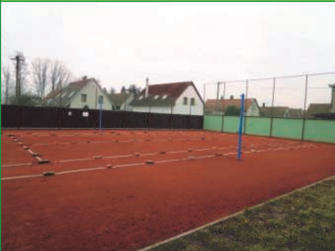
Fiche 1—Volný čas aktivně (5. výzva MAS)