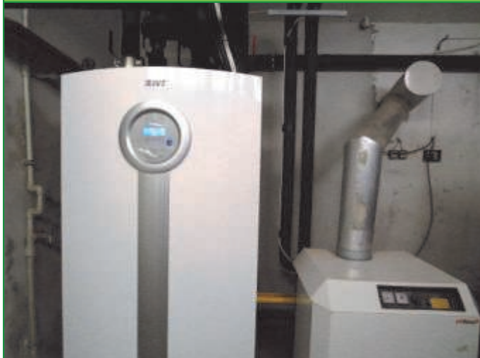
Fiche 1—Volný čas aktivně (5. výzva MAS)

Výsledkem projektu je zrekonstruované tenisové hřiště v Horním Jelení—položení podkladních vrstev a vlastního povrchu hřiště a následné oplocení hřiště. Tenisový kurt bude sloužit ke sportovním aktivitám jak pro stálé návštěvníky sokolovny, tak pro širší veřejnost.