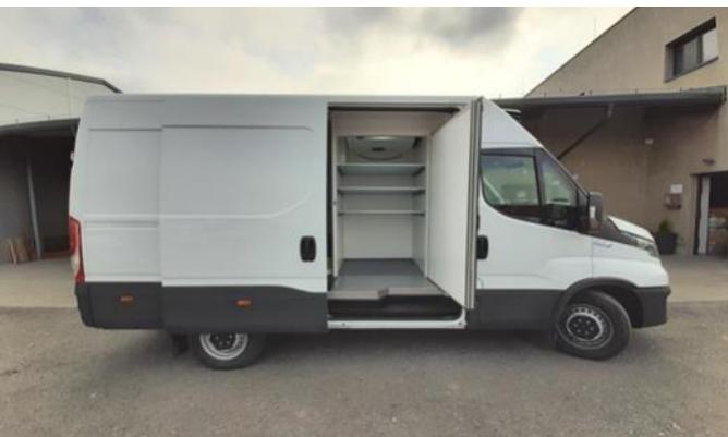
Antonín Jablonský Pořízení chladírenského vozu