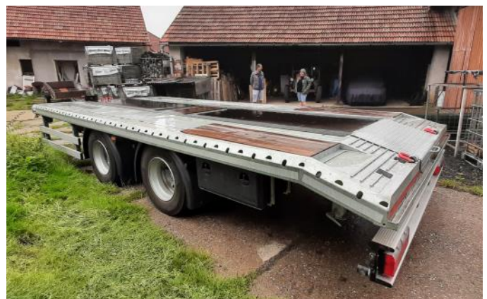
VODA TOPENÍ SERVIS s.r.o. Pořízení techniky do stavební činnosti

Společnost VODA TOPENÍ SERVIS s.r.o. se rozhodla zkvalitnit svou činnost v oboru stavebnictví. Byl pořízen nový nákladní přívěs, který na rozdíl od toho starého dokáže převážet nejen kontejner, ale např. i stavební stroje, palety a stavební materiál. Došlo tak k úspoře nákladů spojených s využíváním služeb na převoz vlastních stavebních strojů či s opravami staršího návěsu. Vykonaná práce je tak efektivnější z důvodu úspory času při převozu výše uvedených věcí.