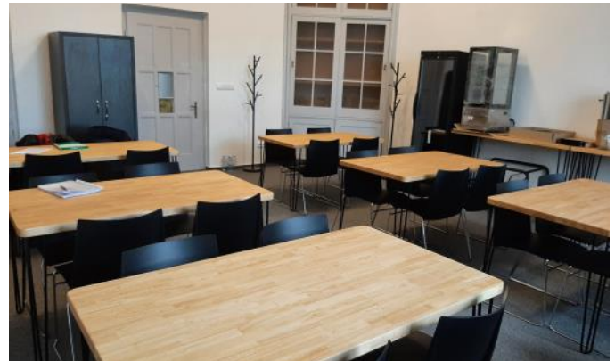
Tělocvičná jednota Sokol Holice Do sokolovny za kulturou a vzděláváním

Díky tomuto projektu sokolovna již nebude v Holicích sloužit pouze pro konání sportovních akcí, ale budou se zde konat i semináře, přednášky, výstavy nebo vernisáže. Nejprve žadatel z vlastního rozpočtu provedl drobné stavební úpravy, poté byly využity dotační finance a to na pořízení stolů a židlí, skříní, věšáků, chladících vitrín, termo ohřívače nápojů, flipchartu a dataprojektoru včetně plátna.