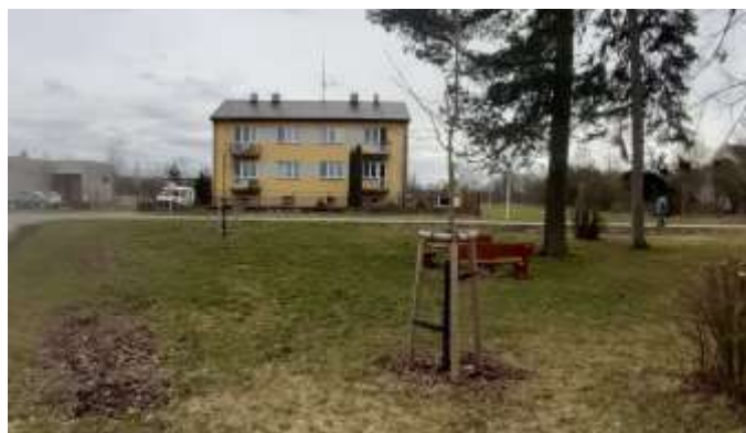
Obec Radhošť Obnova a údržba venkovského parku před bytovkou a částí prostranství bývalého obchodu v obci Radhošť