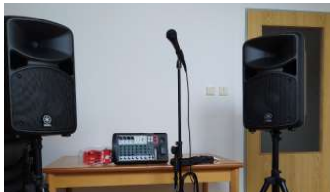
Tělovýchovná jednota Sokol Horní Ředice

Pořízení ozvučovací a projekční techniky