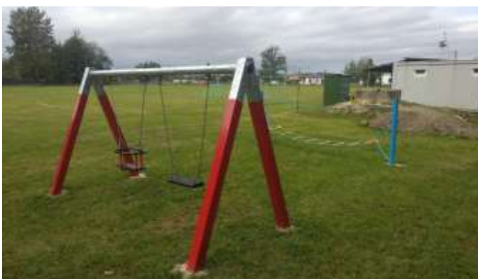
Obec Vysoké Chvojno