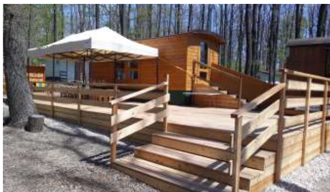
Spolek rodičů a přátel LMŠ Hlubáček Obnova a údržba venkovní terasy