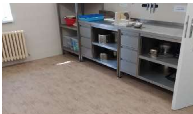
Obec Chvojenec Modernizace prostor v MŠ Chvojenec