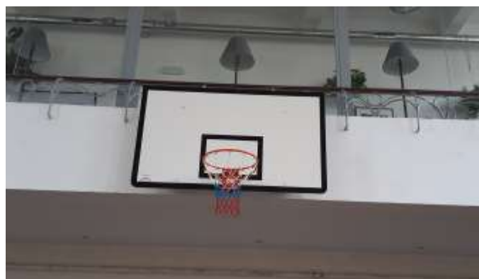
Tělocvičná jednota Sokol Holice Oprava prostorů kotelny a výměna basketbalových košů