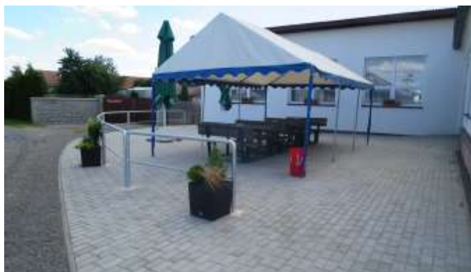
Obec Poběžovice u Holic Oprava veřejného prostranství Poběžovice u Holic - plocha u hospody