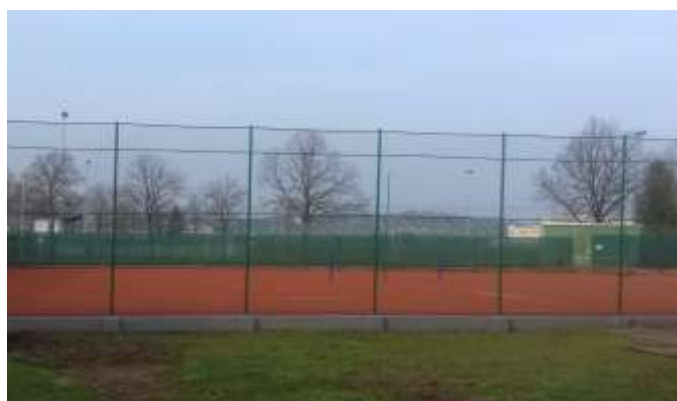
Město Holice Oprava oplocení antukových kurtů - TK Holice