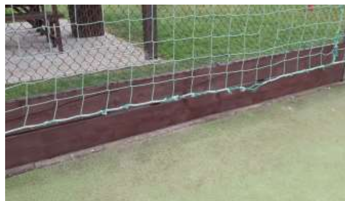
Obec Dolní Ředice

Tvořivá dílnička s Ferdou aneb Ferda keramik