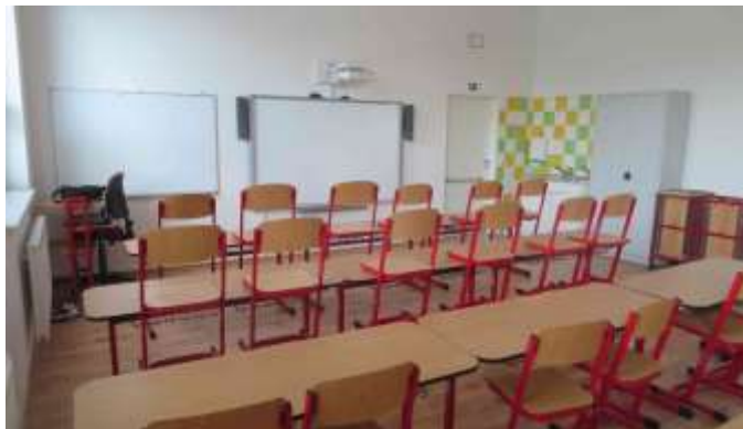
Obec Ostřetín Přístavba základní školy

Základní škola v Ostřetíně je malotřídni škola (do 5. ročníku), která působí v historické budově s omezenou kapacitou. Proto byla nutná přístavba, v rámci které byla vybudována nová učebna pro výuku jazyků. Ta bude také využívána pro výuku informatiky, kroužek angličtiny a hry na flétnu. Součástí projektu bylo i vybudování bezbariérového přístupu do budovy školy a bezbariérového WC.