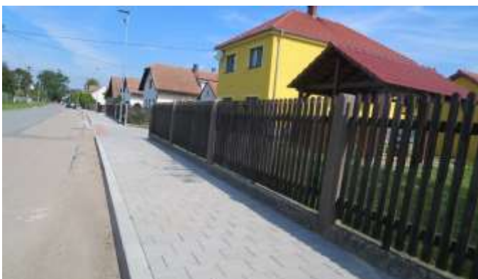
Obec Dolní Roveň Chodník Dolní Roveň