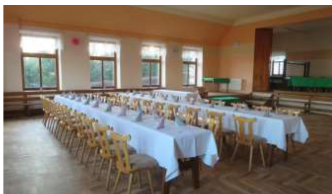
Jana Vondroušová Výměna podlahy v tanečním sálu a v lokále Hostince u Červinků - Horní Ředice č. 47

Hostinec u Červinků je nejenom klasická hospoda v obci Horní Ředice, ale protože disponuje velkým sálem a pódium, je využívána i pro kulturní a společenské akce realizované jak obcí, tak i místními spolky (dobrovolní hasiči, sokol, ochotníci, škola, ...). V rámci projektu musela být stará podlaha, která byla napadena dřevomorkou, odstraněna. Následně došlo k sanaci podkladu, vybudování systému odvětrávání podloží a položení nové parketové podlahy s olejovým nátěrem. Do lokálu byla dána vinylová podlaha.