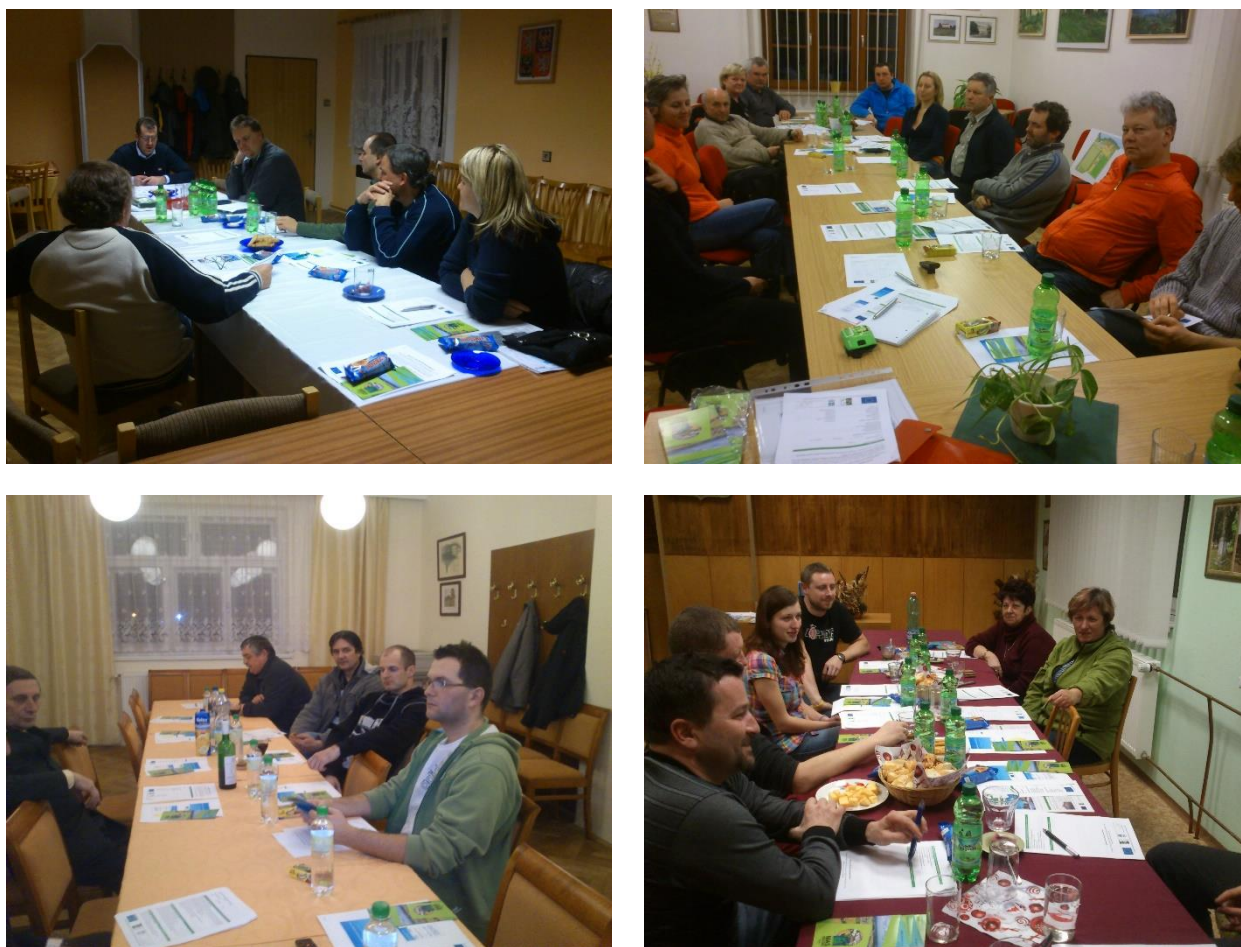
Obr. 1: Fotodokumentace diskusních skupin